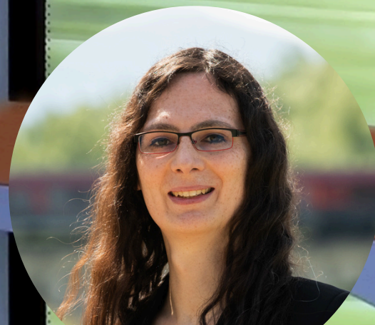
Victoria Broßart Bundestagsabgeordnete