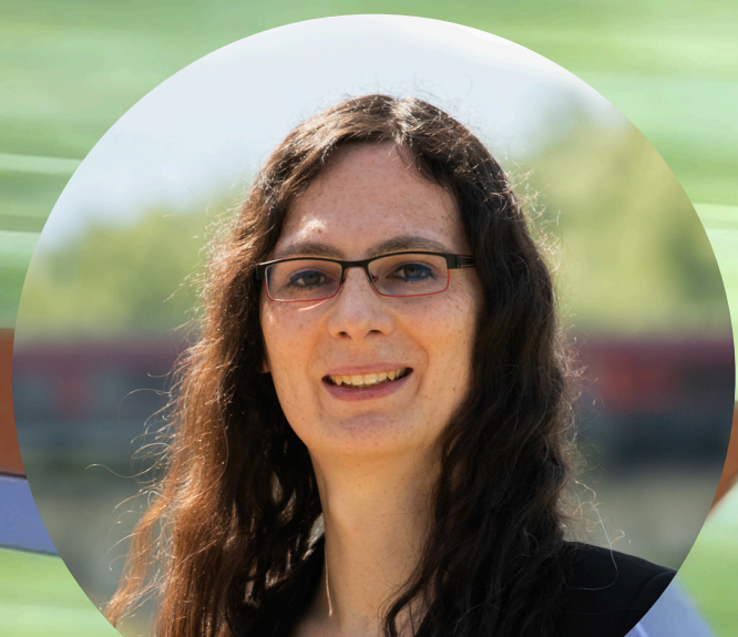
Victoria Broßart Bundestagsabgeordnete