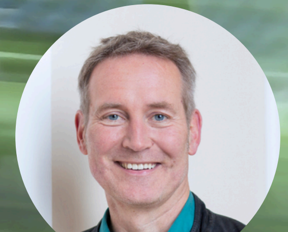
Markus Büchler Landtagsabgeordneter